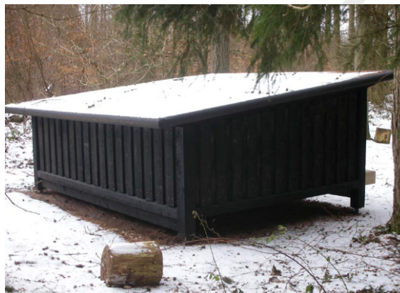
Fotos af en shelter af den type der opsættes

Beliggenheden fremgår af nedenstående oversigtskort med et grønt piktogram for shelters.